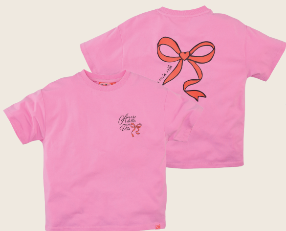
ETNEY // SORBET PINK SIZES 92-152