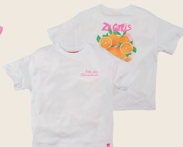
CYNZIA // BIANCO SIZES 92-152