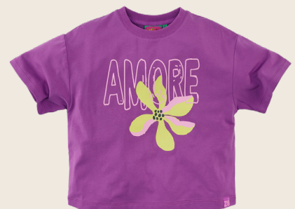
ANIELA // OLA VIOLA SIZES 92-152