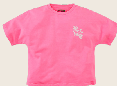
MIMI // CHAOTIC PINK SIZES 92-152