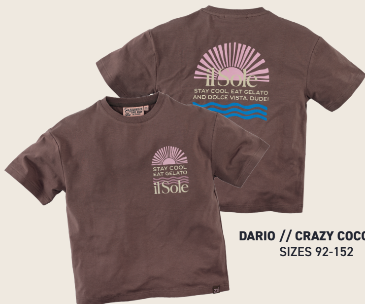
DARIO // CRAZY COCONUT SIZES 92-152

Alle Z8 summer boys t-shirts zijn in deze nieuwe oversized fit.