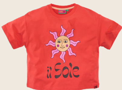
JULIETTE // TROPICAL CORAL SIZES 92-152

Losvallend boven je bottom piece voor een edgy look.